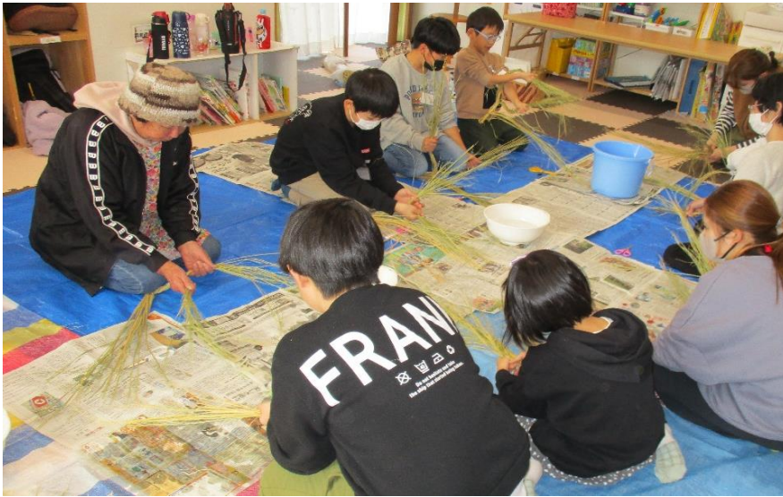
(11月30日 しめ縄づくり)