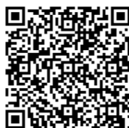
ホームページQRコード